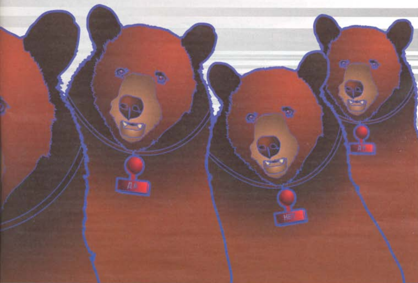
Ilustrace: Pavl Dulek

nem a může vykonávat jakýkoli druh činnosti, který není zákonem zakázán.